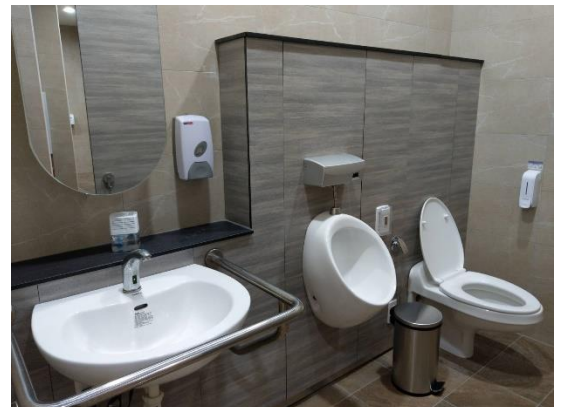
樹林保安市場性別友善廁所