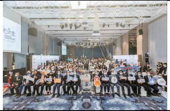
(二) 建構性別友善環境及推動相關政策措施等之政策措施