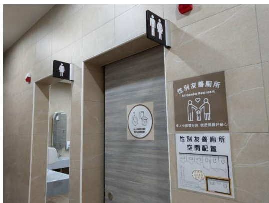
五股公有市場性別友善廁所

前往市場採購者多為女性，檢視每日市場平均客流量，五股公有市場約為 2 千多人、樹林保安市場約為 4 千人左右、鶯歌美食廣場約為 2 千多人，設置性別友善廁所可於尖峰時段適時機動調整女性廁所可用間數，以改善女性廁所前大排長龍現象，亦可提供媽媽帶兒子或爸爸帶女兒不同性別的親子間協助如廁需求。於 111 年度預計設置 3 座性別友善廁所，截至年底共完成五股公有市場、樹林保安市場及鶯歌美食廣場 3 座性別友善廁所。