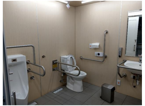
鶯歌美食廣場性別友善廁所