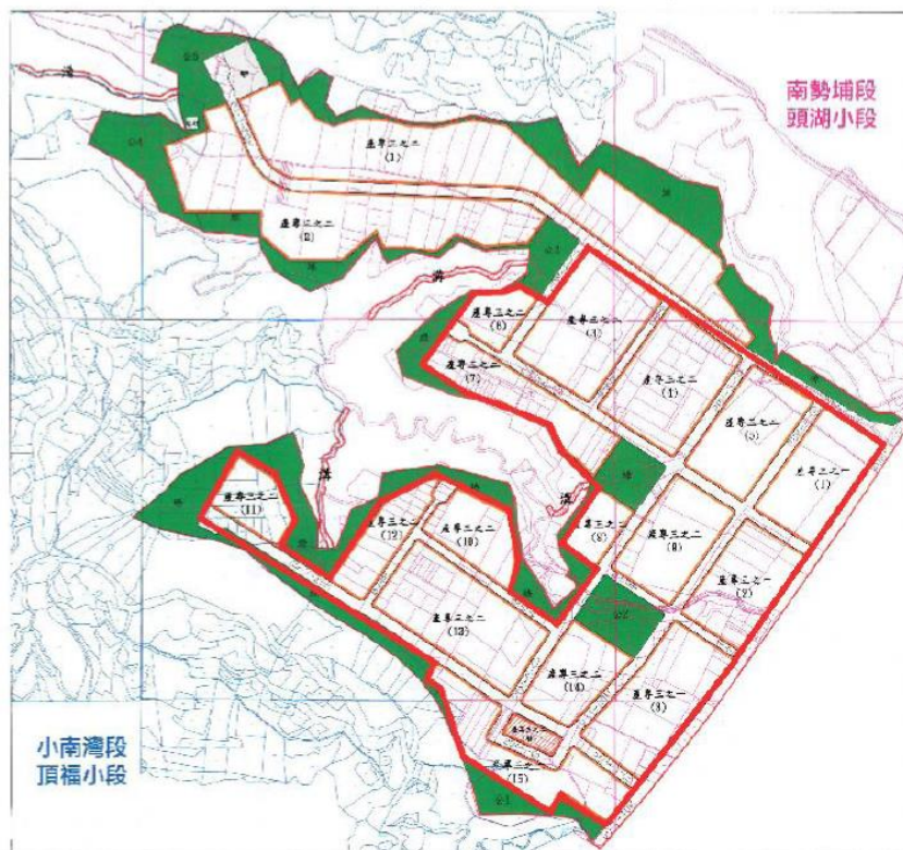
圖三 新北國際AI+智慧園區(原工一工業區，林口區新頭湖段及南勢埔段頭湖小段部分地號共242筆土地，112年7月1日實施範圍為紅框處。)