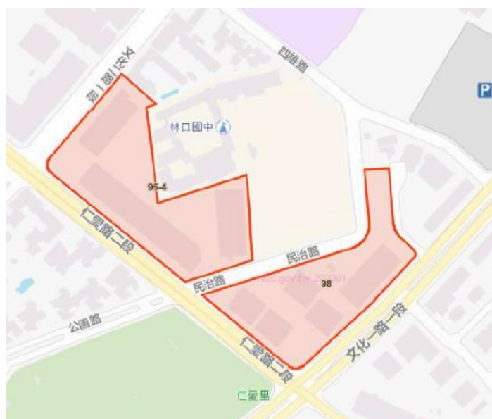
圖一 林口新創園(林口區國宅段95-4及98地號)